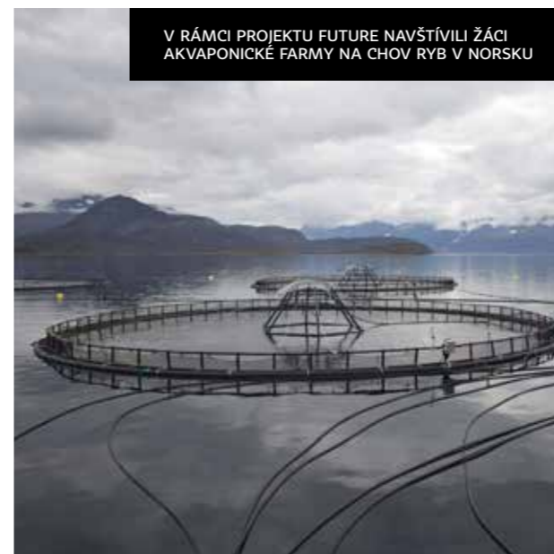
V RÁMCI PROJEKTU FUTURE NAVŠTÍVILI ŽÁCI AKVAPONICKÉ FARMY NA CHOV RYB V NORSKU