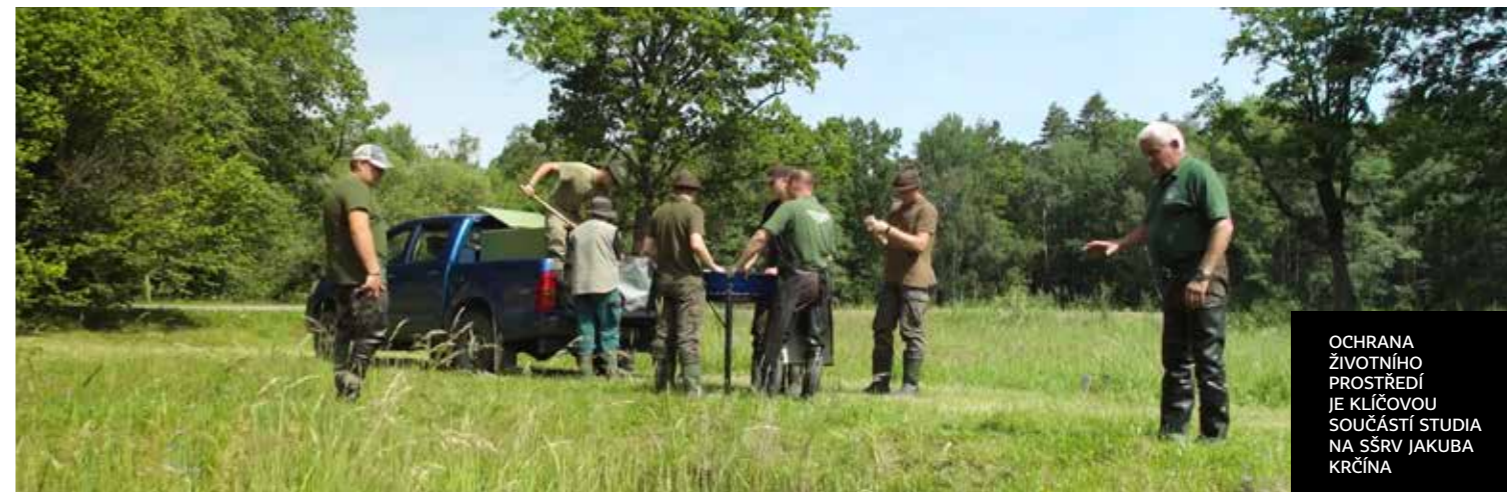
OCHRANA ŽIVOTNÍHO PROSTŘEDÍ JE KLÍČOVOU SOUČÁSTÍ STUDIA NA SŠRV JAKUBA KRČÍNA