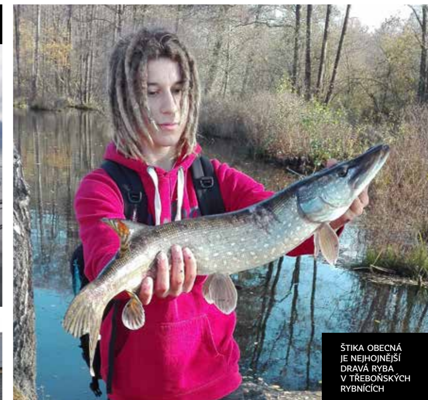
ŠTIKA OBECNÁ JE NEJHOJNĚJŠÍ DRAVÁ RYBA V TŘEBOŇSKÝCH RYBNÍČÍCH