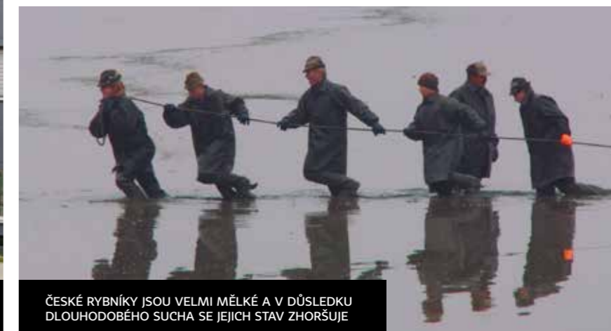
ČESKÉ RYBNÍKY JSOU VELMI MĚLKÉ A V DŮSLEDKU DLOUHODOBÉHO SUCHA SE JEJICH STAV ZHORŠUJE