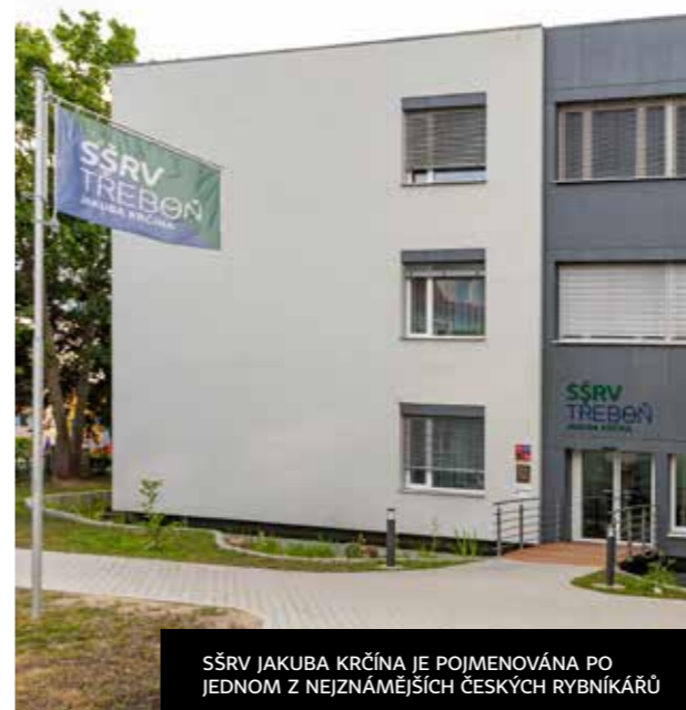
SŠRV JAKUBA KRČÍNA JE POJMENOVÁNA PO JEDNOM Z NEJZNÁMĚJŠÍCH ČESKÝCH RYBNÍKÁŘŮ